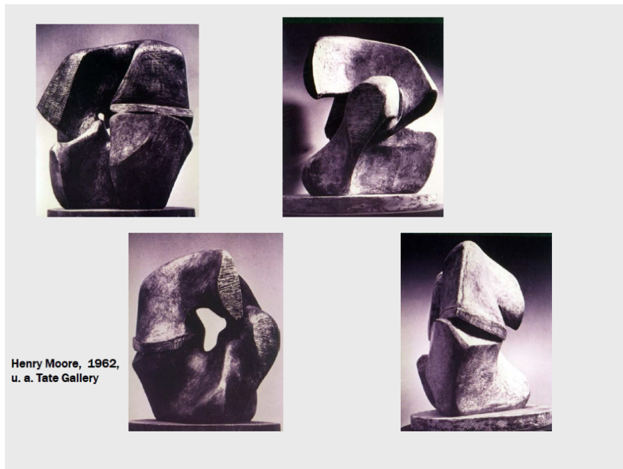
Abb. 1: Henry Moore „Locking Piece“ (Bronze, 1963-64, Millbank, London)

Extrem unterschiedliche ästhetische Erscheinungsformen ein und desselben Gegenstandes in Abhängigkeit von der Betrachtungsperspektive